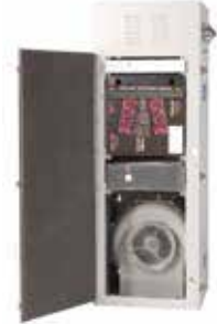
ECU (Electric Cabinet Unit) 電気キャビネットユニット