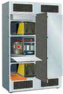
CA (Corrosive Air Unit) 室内設置型循環ユニット