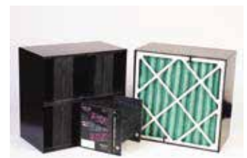
PFA (Purafil Front Access) ダクト組込み型ユニット