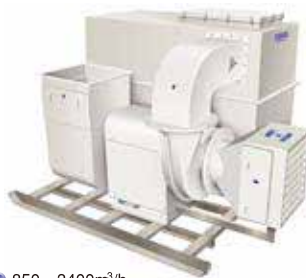
TSS (Tub Scrubber System) 外部設置 単槽型 加圧ユニット