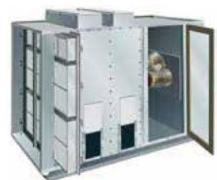
DBS (Deep Bed Scrubber) 外部設置 多槽型 加圧ユニット