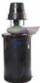
DS (Drum Scrubber) 臭気除去スクラバー