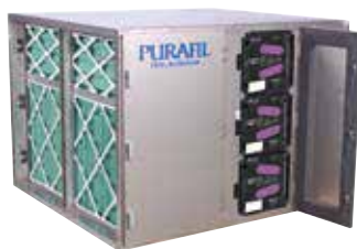
PSA (Purafil Side Access) ダクト組込み型ユニット