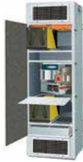
PPU (Positive Pressurization Unit) 室内設置型加圧ユニット